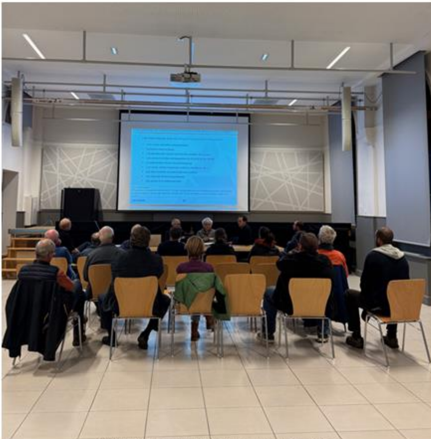
Photographie des participants et intervenants à la réunion publique

Serge JANUS remercie les personnes présentes et clôt la réunion publique à 20h50.