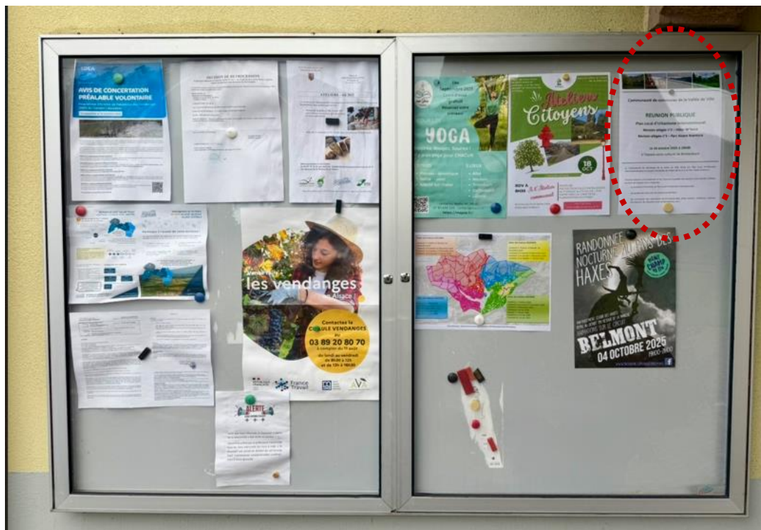
Photographie du panneau d'affichage de la communauté de communes, 9 octobre 2025

Des communications indiquant la réunion publique ont été affichées à la communauté de communes et à la mairie.