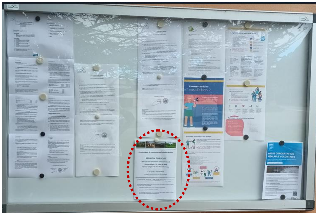
Photographie du panneau d'affichage de la mairie de Breitenbach, 9 octobre 2025