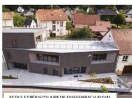
ECOLE ET PÉRISCOLAIRE DE DIEFFENBACH AU VAL

Le dernier périscolaire construit est celui de Dieffenbach-au-Val, il dispose de 50 places qui s'ajoutent à celles des sites de Thanvillé, St-Maurice, Fouchy, Neuve-Eglise et celui qui se trouve dans les locaux de la MJC pour un total à la rentrée 2022 de 272 places. Selon les créneaux choisis par les familles, le nombre d'enfants accueillis dépasse les 450 auxquels s'ajoutent l'accueil familial et celui du Réseau d'assistantes maternelles indépendantes.