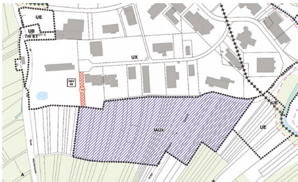
L'extension de la Zone d'Activités Intercommunale : un secteur modifié pour mieux prendre en compte la biodiversité suite à de nombreuses remarques lors de l'enquête publique.

Pour ne pas fragiliser le document et préserver des zones d'extension, les 18 communes ont décidé de faire un ultime effort en réduisant encore 19 ha de zones prévues à l'urbanisation.