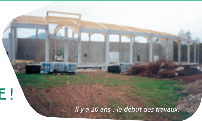
Il y a 20 ans : le début des travaux.