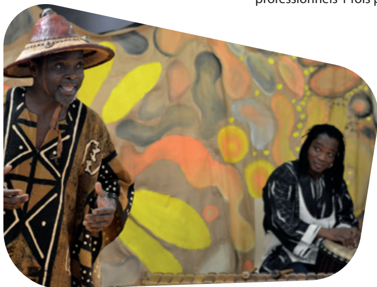
Soirée contes africains

Retrouvez l'actualité de la médiathèque sur le portail : www.biblio.bas-rhin.fr onglet Sarre-Union/Villé , page Ma médiathèque à Villé ou sur la page Facebook BDBR67 !