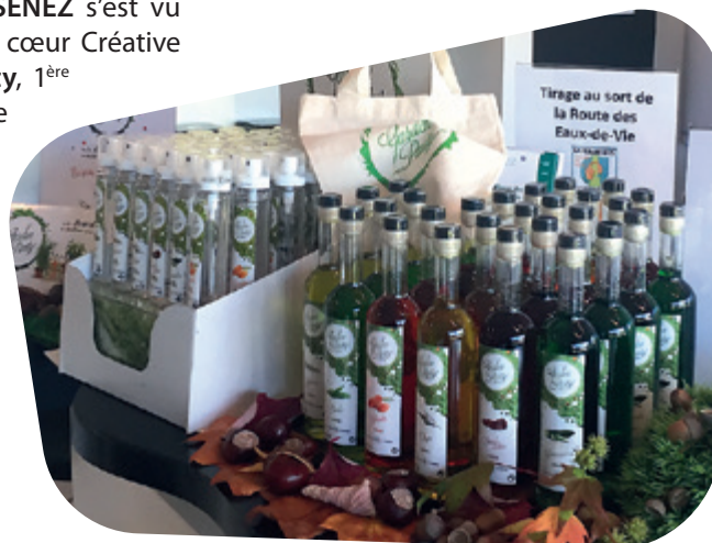
La gamme « Garden Party »

Associations classiques comme le Spray basilic Garden Party sur vos salades de tomates ou encore le Spray thym sur un carré d'agneau et plus audacieux encore le Spray concombre sur vos huîtres. Au total se sont près d'une dizaine de produits nouveaux qui ont été primés.